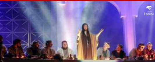
Auto de Natal